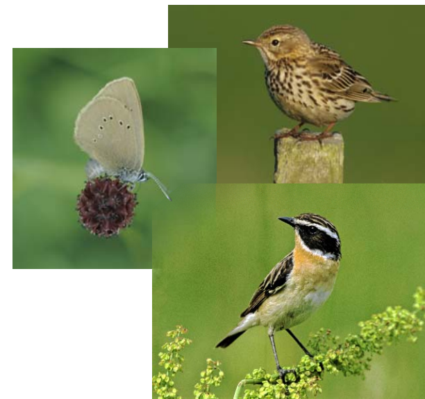
Junger Wiesenpieper (oben), Dunkler Wiesenknopf-Ameisenbläuling (links), und Braunkehlchen (unten) - Charakterarten des großflächigen extensiven Mähgrünlandes

Wiesenpieper und Braunkehlchen bevorzugen offenes und gehölzarmes, z.T. von Gräben und