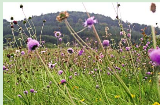
Artenreiche, bunte Blumenwiese dank angepasster Grünlandnutzung

In den letzten Jahren konnten zahlreiche Landwirte gefunden werden, die mit Hilfe von Fördermitteln aus dem Hessischen Integrierten Agrarumweltprogramm (HIAP) auf derzeit etwa 126 ha die verschiedenen Grünlandtypen entsprechend der Maßnahmenplanung bewirtschaften.