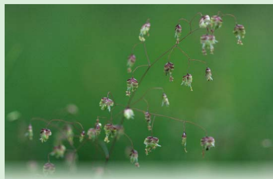
Zittergras - eine typische Art der Pfeifengraswiesen