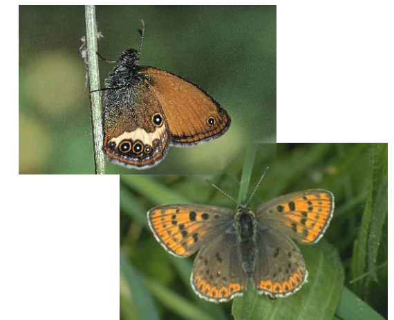
Brauner Feuerfalter, Weibchen (unten) und Perlgrasfalter (oben) - typische Vertreter der Falter extensiver Mähwiesen