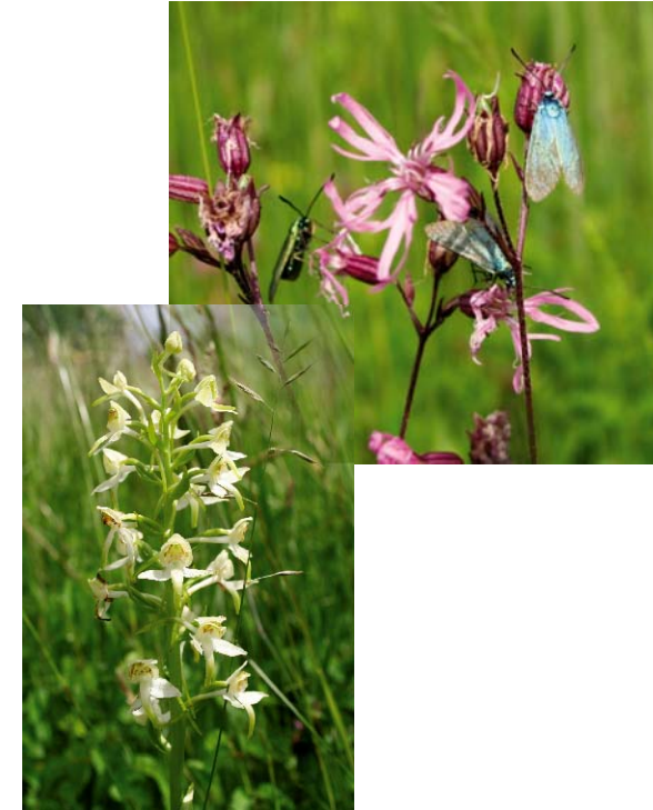
Gemeines Ampfer-Grünwiderchen (oben) und Grünliche Waldhyazinthe (unten) - Vertreter feuchterer Mähwiesen und Waldsäume

Altgrasstreifen durchzogenes Gelände mit relativ hohem Grundwasserstand. Wichtig ist eine Deckung bietende Krautschicht, die für das Braunkehlchen auch lückig sein kann und von Ansitzwarten überragt werden sollte.