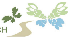
Gemeinde Bad Endbach